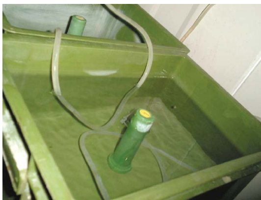
上層採溢流方式對下給水