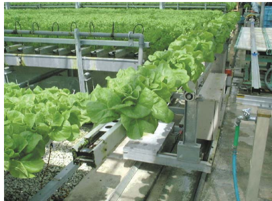
機械手臂自動搬運