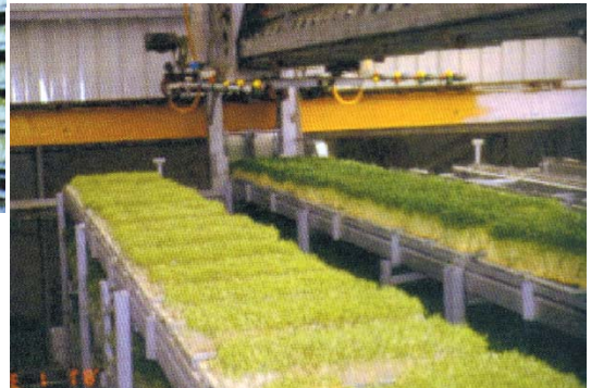
綠化芽苗菜立體栽培管理