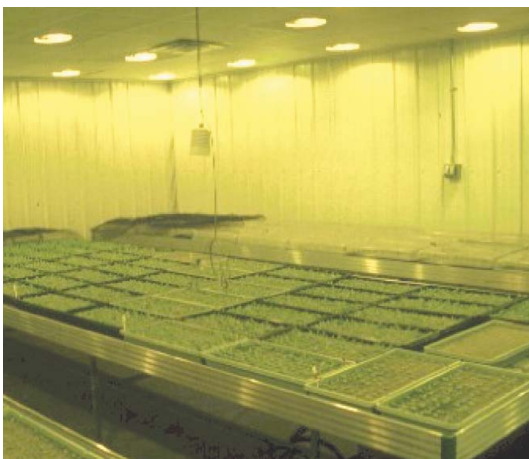
種子置於環控室催芽3天