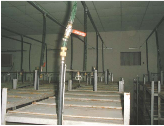
室內催芽立體床架