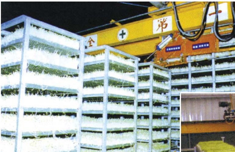
綠豆芽自動生產出料