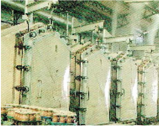
120 度 C 蒸氣殺菌消毒