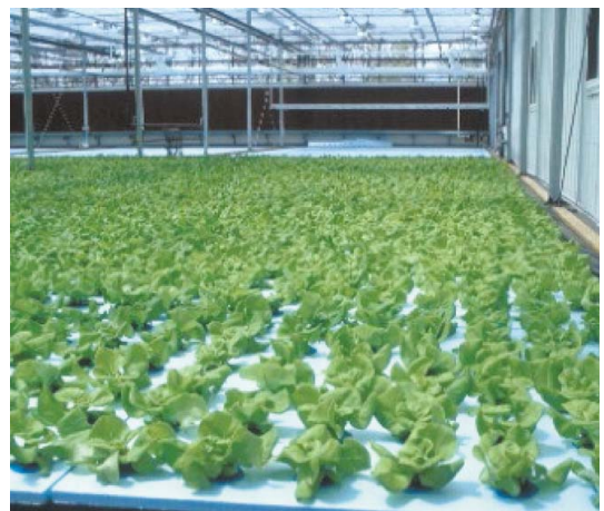
溫室23天（平均萵苣重 150 克／株）