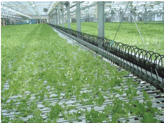
溫室：量產（間距自動調整）