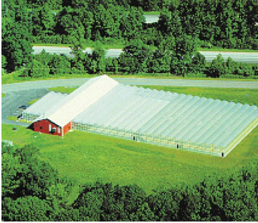
蓋於垃圾掩埋場舊址的示範溫室