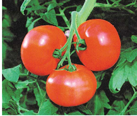
定期定量生產固定品質的番茄