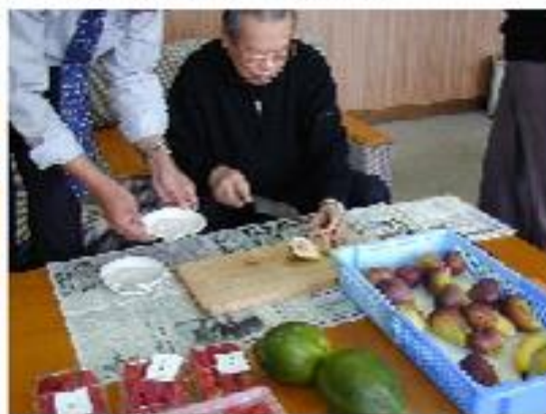
浦臼町長室での代表自らの南国果実試食会