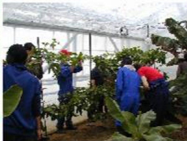
塾生ハウスでの実習