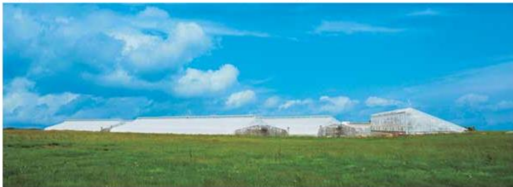
フィルムハウス全景