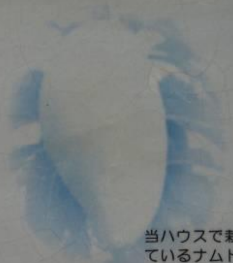
当ハウスで栽培されているナムドクマイの完熟状態。