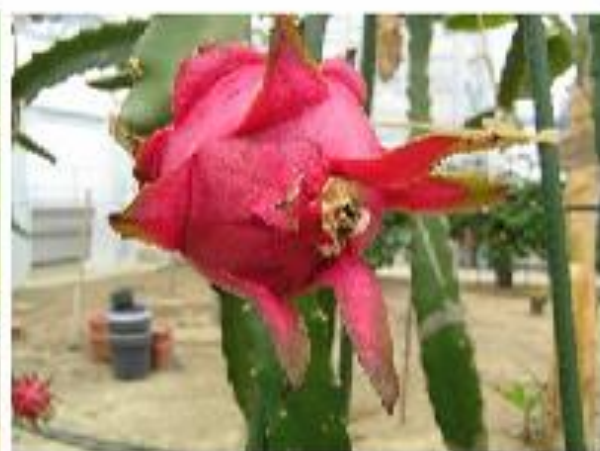
ドラゴンフルーツ